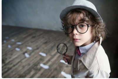
Tous à vos plumes !

L'association lectoroise « Le 122 », qui a créé en 2013 le Festival Polars et histoires de police, lance un nouveau concours de nouvelles policières en langue française dont le cadre est le département du Gers.