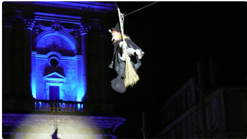
Magique descente de la Béfana du haut de la cathédrale.