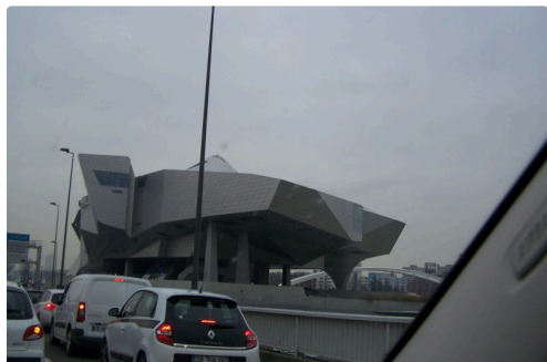
Sous un autre angle

En conclusion, la balade de cet après-midi fut des plus instructives, cependant elle fut trop rapide, il ne reste plus qu'à y revenir, les expositions temporaires telles que l'univers d'Hugo Pratt ou les Coléoptères insectes extraordinaires méritaient aussi un bel intérêt. À une prochaine fois !