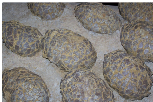
Des tortues immobiles