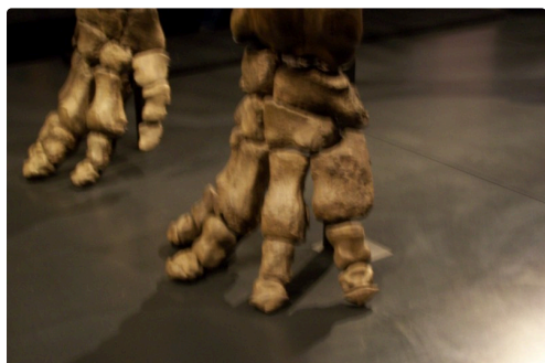
noel lyon 2018 029.JPG