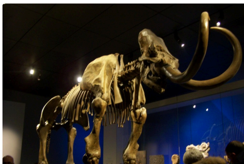
Un gigantesque squelette de mamouth