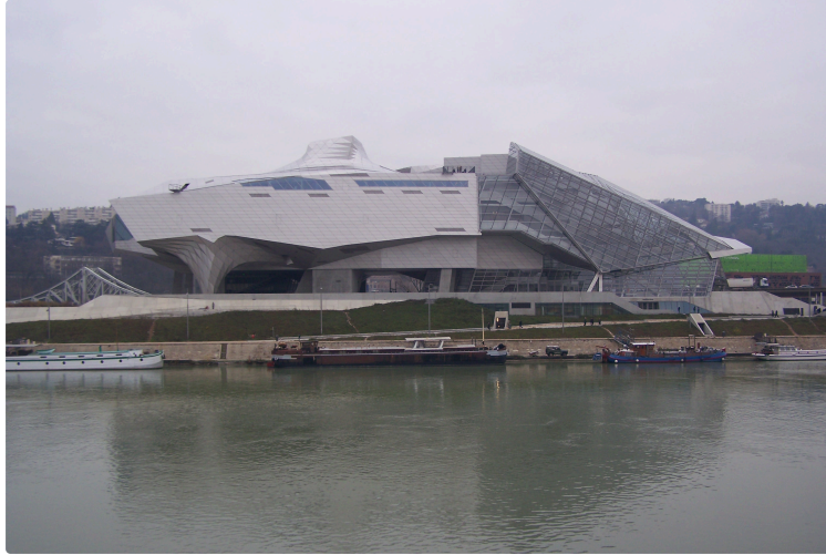
Un lieu exceptionnel dans lequel la culture a une place prépondérante.

Photo : Le Musée vu du Pont Raymond Barre