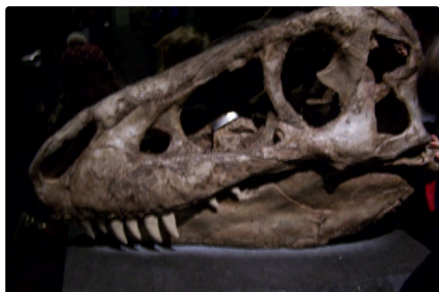
noel lyon 2018 023.JPG