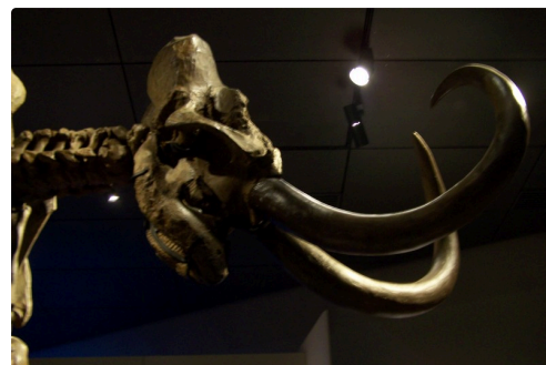
... sa tête de plus près