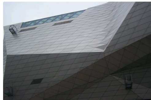
noel lyon 2018 014.JPG