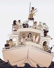
Illustration: M. B. / M. B.

CAHORS | CARCASSONNE | COLOMIERS | LABROGUIÈRE | LAVELANET | L'ISLE-JOURDAIN L'UNION | SAINT-GIRONS | MURET | TARBES | TOULOUSE | TOURNEFEUILLE