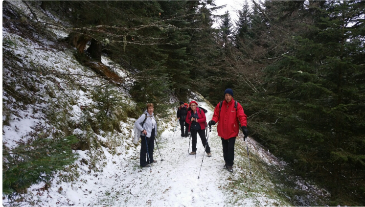
Première sortie hivernale

La sortie prévue le dimanche 13 janvier 2019, à cause de la météo incertaine, a finalement été maintenue. Bonne idée car le soleil était au rendez-vous dans la vallée de Campan.