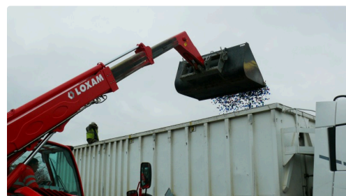
Le 8 janvier, 60 m3 soit 9 tonnes de bouchons iront en Belgique pour être recyclés en palettes.