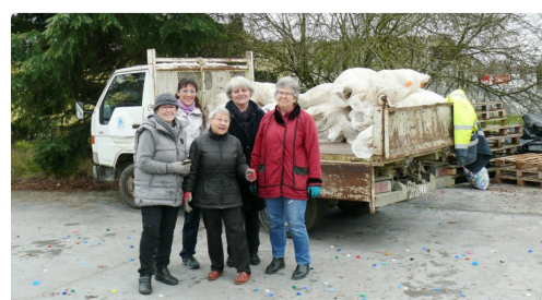
L'équipe féminine d'Auch qui se charge du rangement des sacs.