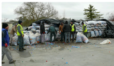
Stock de bouchons qui seront dans le camion.