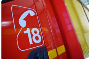
Faits Divers : carambolage sur la RN21

PAVIE - Un carambolage sur la RN21 a fortement perturbé la circulation qui, un moment, a dû être totalement fermée dans les deux sens vers 19 h 30. Trois véhicules impliqués dans cet accident qui a fait trois blessés sans gravité transportés sur l'hôpital d'Auch par les sapeurs-pompiers de Pavie, Auch et Montesquiou. Il s'agit de deux hommes 50 et 70 ans et une femme de 72 ans. Sur place, la gendarmerie a établi les constatations d'usage. Deux véhicules se seraient accrochés en se croisant un troisième venant les percuter aucun blessé dans ce dernier véhicule.