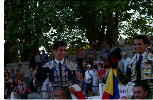
Solalito et Valencia ont été les triomphateurs 2018