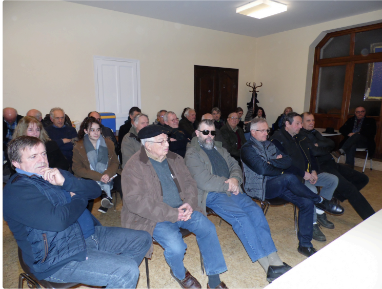
Peña "Vivement Cinq Heures" en assemblée générale

Une grande trentaine d'adhérents sur la cinquantaine que compte la Peña Vivement Cinq Heures assistaient samedi soir, salle de l'étage de la mairie, à la présentation des résultats de la "temporada" 2018.