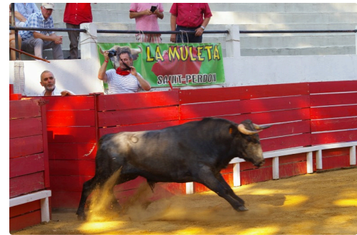
Beaucoup d'envie d'en découdre des la sortie de ce Turkey