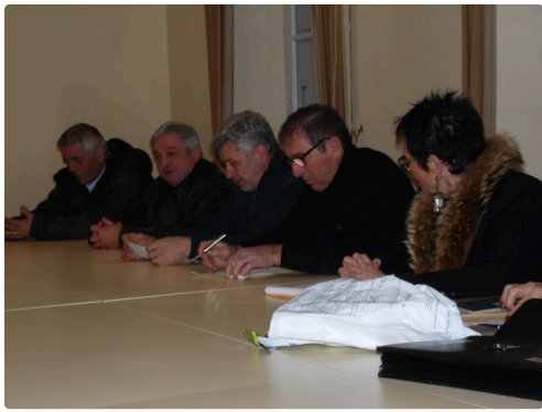
Bureau et élus lors de l'assemblée générale