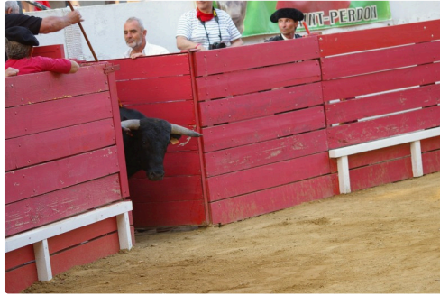
Sortie tranquille d'un Saine Cécile, chez aucun des "vintage" de 2016 et des trois de 2018, on n'a retrouvé l'allégresse du gagnant de 2015 à Castelnau