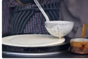
Les crêpes de la Chandeleur

Voici la règle à respecter pour faire sauter les crêpes le jour de la Chandeleur.