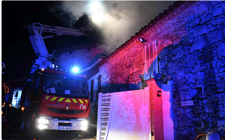
Dramatique incendie à l'Isle Bouzon

Le propriétaire découvert décédé à proximité