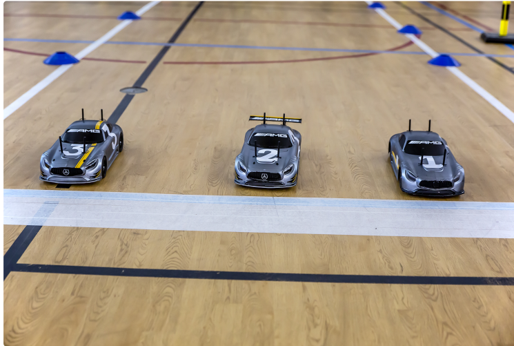
En attendant une voiture à pile à combustible au lycée de Nogaro

Nous voici subitement dans le monde de demain. Pourtant, ce jeudi 31 janvier, nous sommes au gymnase du lycée d'Artagnan de Nogaro, mais nous assistons à une course de 3 maquettes de voitures, construites et pilotées par 3 équipes d'élèves. Elles sont à énergie électrique - des batteries classiques. Mais, dès ce mois-ci, elles vont être remplacées par 3 voitures à pile à combustible dont l'une est sur place (voir photo).