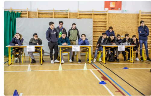
Les 3 équipes