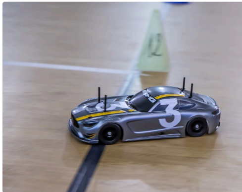
La voiture n°3