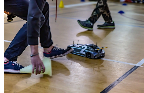
Remise en place d'une borne touchée par la n°2