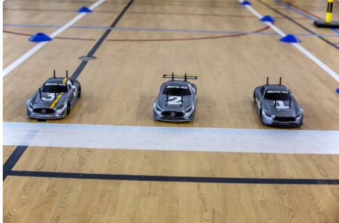
Les 3 voitures au départ