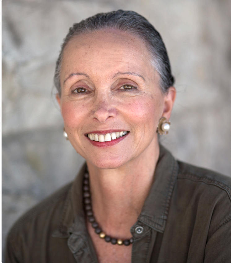
Rencontre avec Ofra Yeshua-Lyth

Écrivaine israélienne autour de son livre