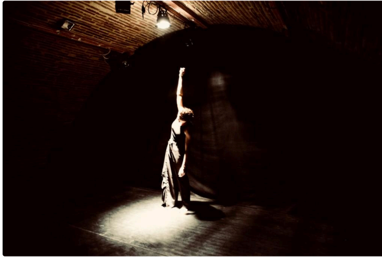
"Aïe ! Un poète !"

Le spectacle "Aïe ! un poète !" est un voyage poétique à travers le temps où se mêlent danse, théâtre et poésie.