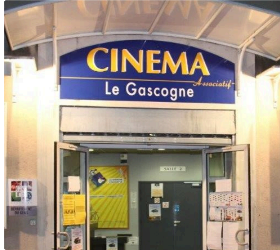
Cinéma et ruralité

8ème édition du 22 février au 22 mars 2019