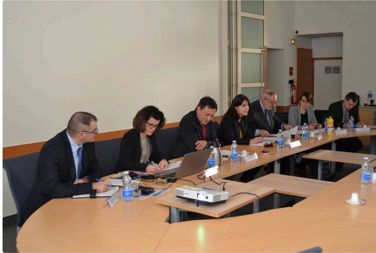
Commission de surendettement : bilan 2018