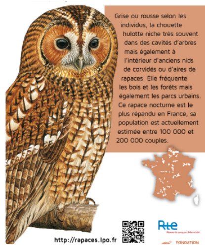
Extrait du Dépliant "Rapaces Nocturnes".