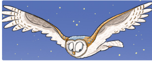
La Nuit de la Chouette .... c'est forcément chouette !

En 2019, la Nuit de la Chouette, c'est un mois de fête !