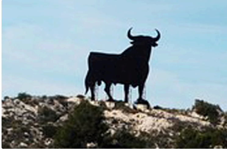
Echos du calejon