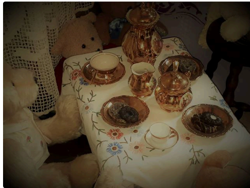
A l'heure du thé