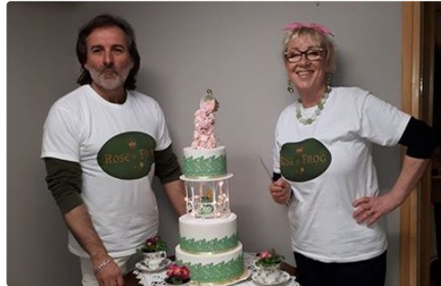
Rose & Frog inaugure sa salle d'exposition