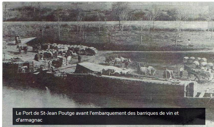
Quand la Baïse était navigable

Le mardi 19 février, la section randonnée de l'association de la gymnastique volontaire vicoise a choisi le secteur de Pléhaut (près de Saint-Jean Poutge) pour le circuit de sa marche du mardi. Peut-être les randonneurs emprunteront-ils le chemin de halage où pendant des décennies des attelages de boeufs et de chevaux tirèrent la gabarre.