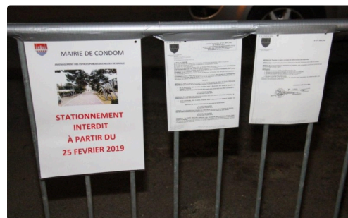
La signalétique déjà en place