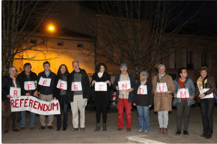
Dossier des Promenades

Les associations demandent un référendum local