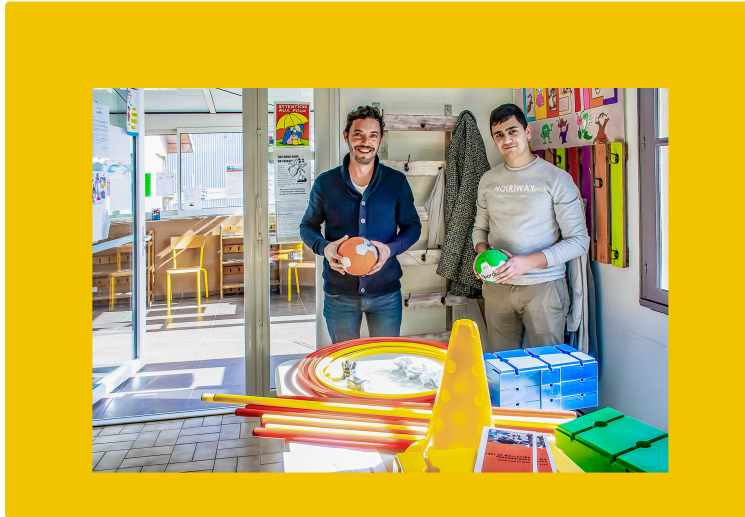
Le Clan emprunte des mallettes pédagogiques

À la Ligue de l'enseignement et aux Francas