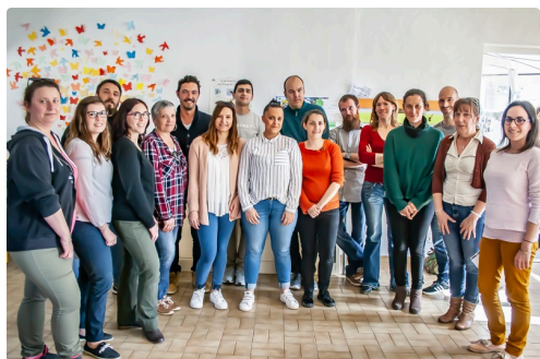
L'ensemble des animateurs venus du territoire de la CCBA et d'au-delà