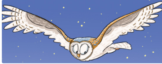
Sortie nature à la découverte des rapaces nocturnes

Dans le cadre de l'Atlas de la Biodiversité du Grand Auch Cœur de Gascogne et pour la 13 ème édition de la Nuit de la Chouette, le Groupe Ornithologique Gersois, créé en 1990 et baptisé La Tchourre (*), vous convie, le samedi 2 mars 2019, de 19 h 30 à 22 h , à le rejoindre pour une sortie nocturne, à la découverte des rapaces présents sur la commune de Lavardens.