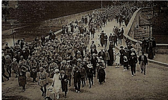
Il y a cent ans... 1919 : le retour des soldats

À l'occasion du centenaire de la première guerre mondiale, la Société archéologique du Gers et les écrivains publics du Gers se sont associés pour vous faire découvrir la chronologie des événements marquants de la Grande Guerre, tels qu'ils ont été vécus par les Gersois, au travers des grandes batailles qui l'ont émaillée. Chacun d'eux sera l'occasion d'un article qui en reprendra les grandes lignes et s'appuiera sur des portraits d'hommes, soldats gersois, morts ou disparus. L'idée de cette série est de leur rendre hommage pour qu'à travers eux, le sacrifice de tous ceux de 14 ne soit pas emporté par l'oubli, même cent ans après.