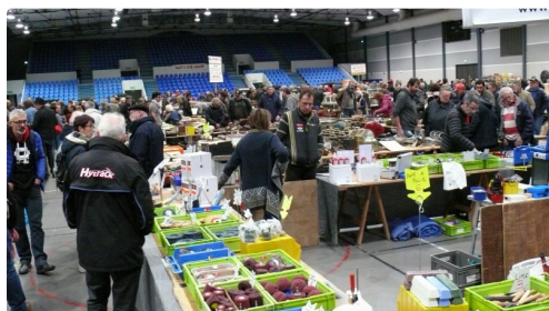
Ce sont quelques 2.000 visiteurs qui sont venus à la manifestation.