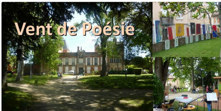
Vent de poésie

Les 16 et 17 mars, au Parc de la Marquise