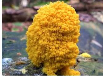
Mais qui est donc ce fameux "Blob" ?...

Ni plante, ni animal, ni champignon, et capable d'apprendre...sans cerveau