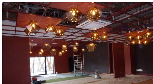
Le côté salle de jeux