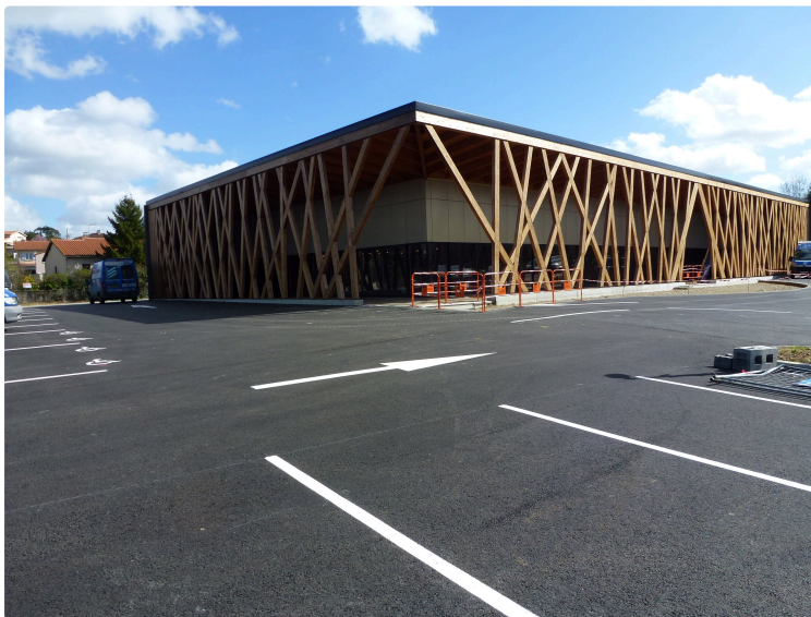
Le casino remplace l'Intermarché !

Non, il ne s'agit pas d'une énième nouvelle grande surface alimentaire sur le département, mais bien d'un établissement beaucoup plus festif puisqu'en fait, il s'agit d'un casino, le troisième du département, après Barbotan-les-Thermes et Castéra-Verduzan.