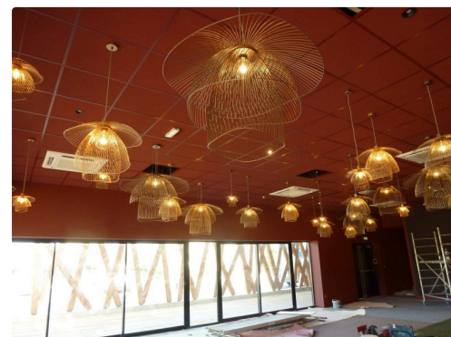
L'entreprise Ligardes peaufine les dernières installations électriques.