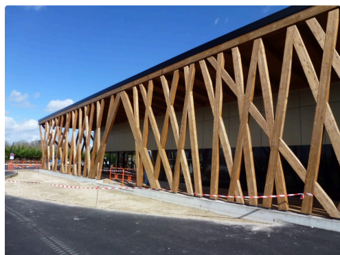
L'entrée principale du nouveau casino : somptueuse !

Bibliographie : Chambre régionale des comptes 12 juin 2018