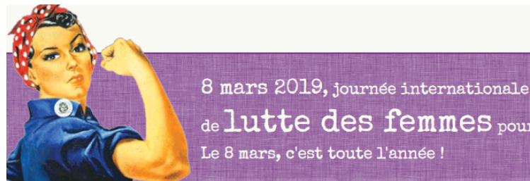
Festival "En Mars'Elles" dans le Gers

Programme des manifestations autour du 8 mars 2019 - Fin du mois de mars