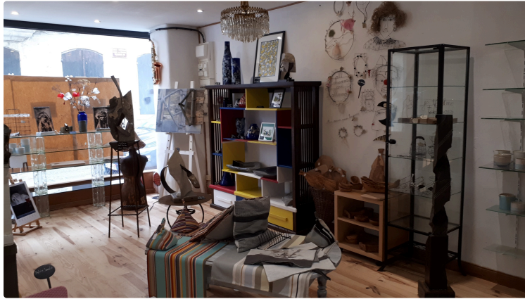
L'Art et la Matière

Le passant qui se rend de la Cathédrale en destination du Village des Brocanteurs, est surpris depuis quelques jours, par un commerce qui reprend vie.