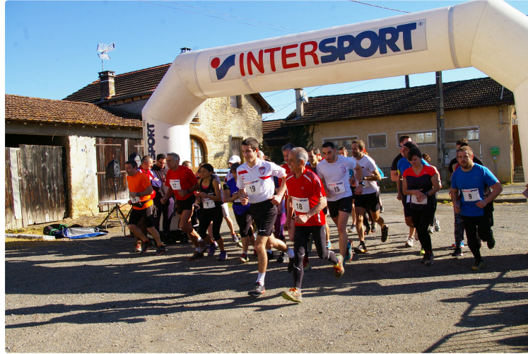
Trail Départemental des sapeurs-pompiers

Trente-cinq concurrentes et concurrents à travers bois vignes et chemins