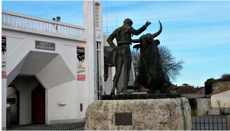
Club taurin vicois

Samedi 30 mars, à Vic-Fezensac, auront lieu les rencontres taurines au cours desquelles la Feria 2019 sera présentée et les prix suivants seront remis :