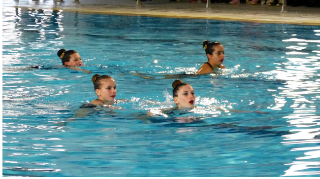
Démonstration de natation synchronisée.