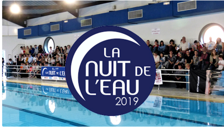
la nuit de l'eau 2019.

Samedi c'était la 12ème édition de la nuit de l'eau dans plus de 230 piscines de France. En 2008, à l'aube de la journée mondiale de l'eau émerge le désir commun à la Fédération Française de Natation et à l'UNICEF France d'améliorer l'accès à l'eau potable pour les enfants les plus vulnérables. La Nuit de l'Eau est ainsi créée, et s'impose depuis, chaque année, comme un événement, sportif et solidaire. Il a pour but de sensibiliser le grand public, à l'importance de l'accès à l'eau, ressource clé pour les populations du monde entier et de collecter des fonds afin de financer les programmes de l'UNICEF d'accès à l'eau potable dans le monde. Faute d'un accès à l'eau potable, les enfants d'Haïti sont en proie à des épidémies de choléra et sont très vulnérables aux maladies hydriques. De plus, cela fragilise leur capacité à aller à l'école. Avec la Nuit de l'eau, UNICEF France et la Fédération française de natation s'engagent pour aider ces enfants.