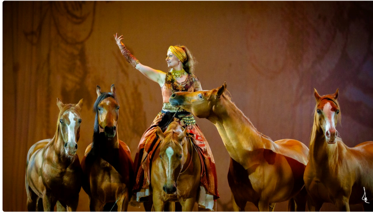
Equestria : 25 ans de magie équestre

Depuis 25 ans déjà, le Festival Equestria fait rêver les Tarbais et tous les amoureux de la plus noble conquête de l'homme. Il se déroule dans le splendide cadre bucolique du Haras de la ville, qui peaufine cette année la rénovation de son manège pour être fin prêt lors de l'événement.