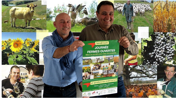
Samedi 6 avril : journées fermes ouvertes

« Mieux se connaître pour mieux vivre ensemble »