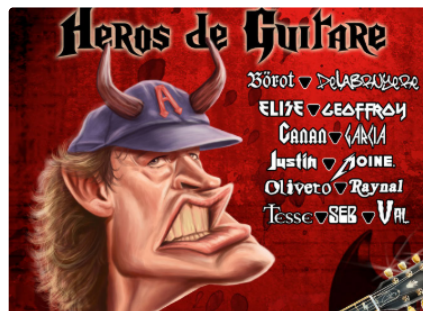
Salon de la Caricature et du Dessin de Presse