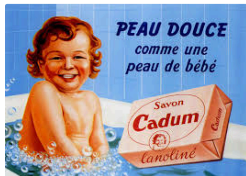
pub antan 3.jpg

L'exposition est visible du 15 septembre au 15 décembre 2015 aux Archives départementales du Gers les Lundis, mercredis et vendredi de 9 heures à 17 heures et chaque mardi de 13 à 17heures - Parc départemental du Gers 81 route de Pessan à Auch