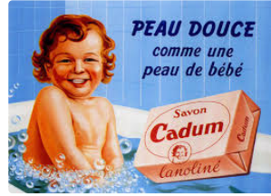
AUCH la pub d'antan

Témoignage d'un patrimoine qui disparaît