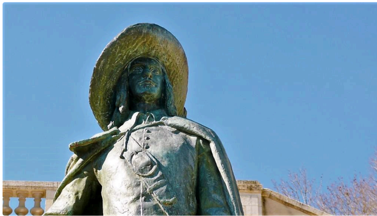
D'Artagnan, le héros de nos campagnes

Le nom de d'Artagnan résonne aux quatre coins du monde et continue aujourd'hui encore de faire rêver des générations entières. Ce que certains ignorent, c'est que le plus célèbre des mousquetaires a réellement existé, avant de devenir une légende de la littérature de cape et d'épée. Légende vivement entretenue par le petit village de Lupiac, au cœur du Gers, où il naquit.