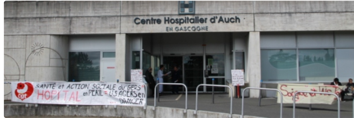
Préavis de grève illimité pour le service d'orthopédie/traumatologie élargi à l'ensemble des agents

L'équipe paramédicale AS et IDE (Aide soignant/infirmier) du service chirurgie orthopédique et traumatologique (1B) du Centre Hospitalier d'Auch, s'est mise en grève depuis jeudi 00 h. En souffrance depuis plusieurs années du fait d'un effectif insuffisant au regard de la charge de travail qui leur incombe.