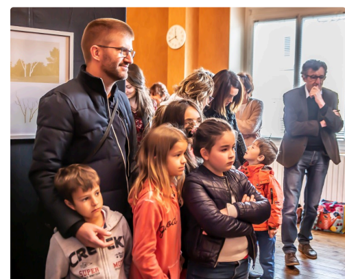
Les enfants présents vont rendre les images lumineuses