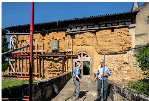
Le rempart du Castet et ses renforts actuels