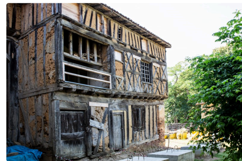
Façade opposée du castet