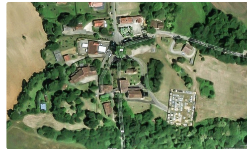
Comparer avec cette carte