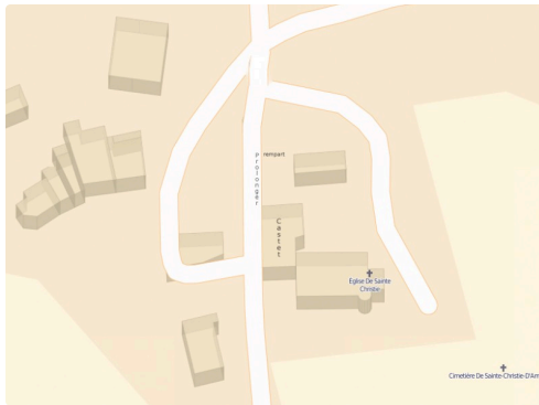
Cœur du village et prolongation éventuelle du rempart