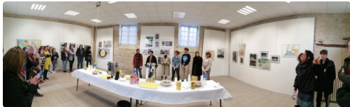
Jour de vernissage