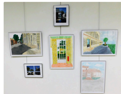
Quelques oeuvres exposées