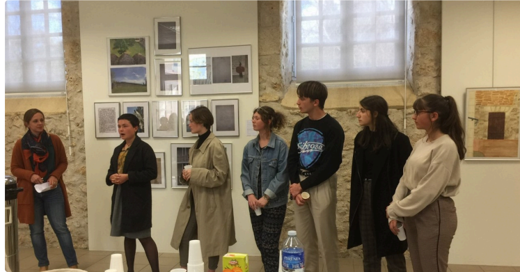
"109 500 jours après..."

L'exposition pour les 300 ans des bâtiments du lycée Bossuet