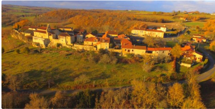
Randonnée du mardi 16 avril autour de Caillavet