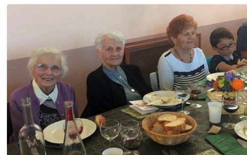
Toutes générations confondues