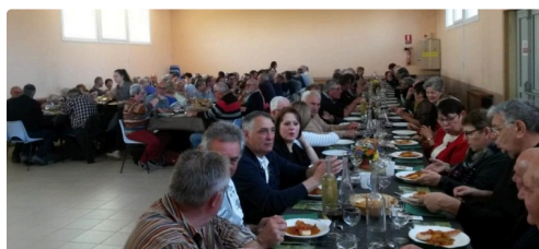
Tous à table !

Sans oublier bien entendu les chasseurs du village, associés à ceux de Margouët-Meymes, Castelnavet et Aignan, fidèles en leur amitié, qui, grâce à l'esprit de solidarité, ont permis de ne pas rentrer bredouille lors des battues hivernales.