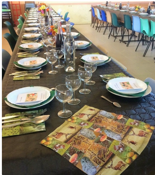
Une table soigneusement préparée