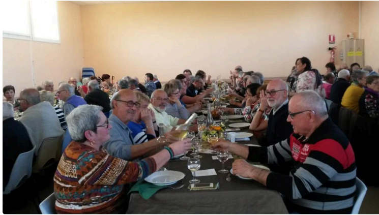
Fin de saison pour les chasseurs

Toujours clôturée par un banquet très apprécié