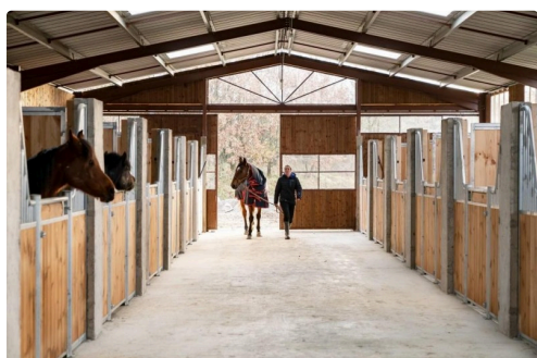
Tout le confort adapté aux chevaux