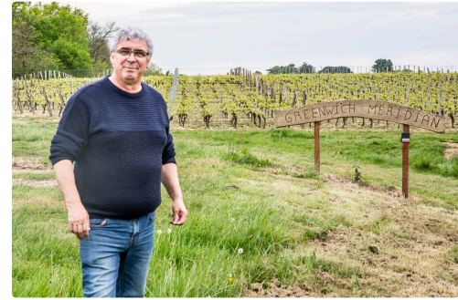
Les photos seront posées de part et d'autre du panneau