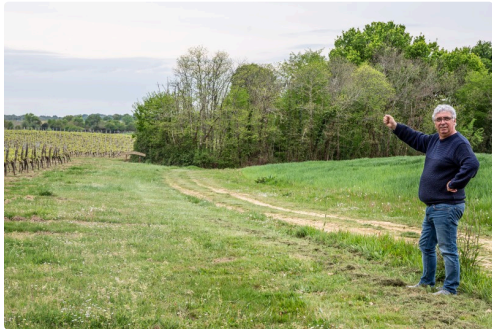
Les 30 portraits seront échelonnés sur ce chemin