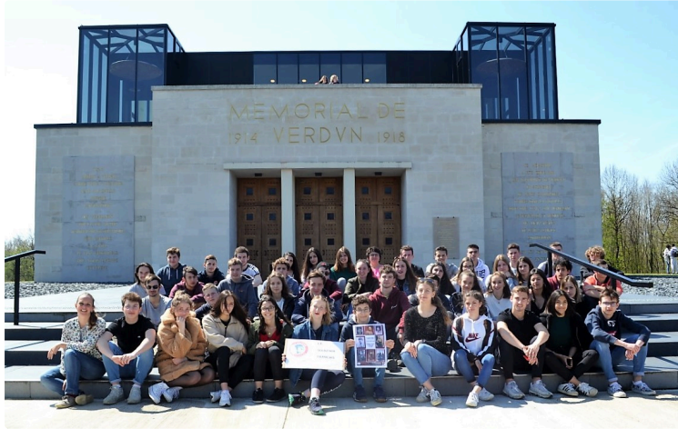
« Des vies derrière la pierre, de toi à moi, chemins de transmission de la mémoire »

Clôturent le cycle de commémorations du Centenaire de la Première Guerre mondiale, c'est un groupe de 46 élèves de Première du lycée Bossuet qui est parti le 15 avril vers les lieux de mémoire.