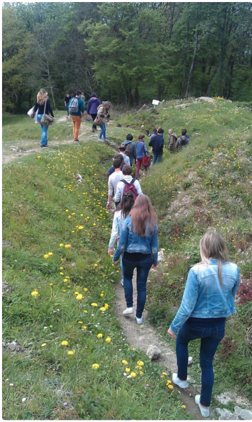
Vers les lieux de mémoire