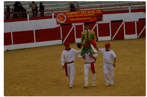
Avec deux oreilles gagnées devant ses adversaires, il sort à hombros des arènes Aignanaises.