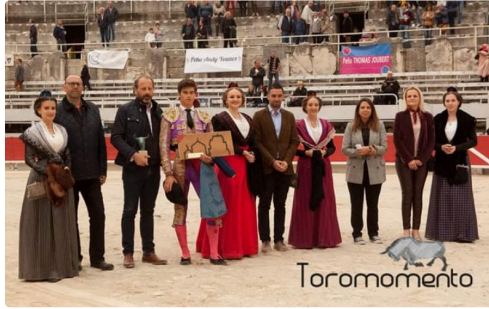
Le bouquet final