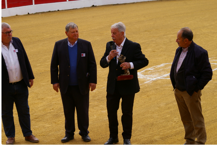
Pâques taurines exceptionnelles pour le "Lartet"

A Aignan en non piquée, à Arles en concours piquée, les récompenses tombent.