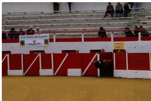
Le premier novillo, un castagno

Belles Pâques taurines pour le "Lartet" !