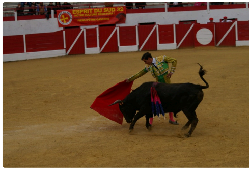
Et à la muletta