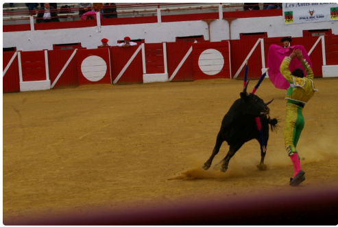
Solalito aux bandérites