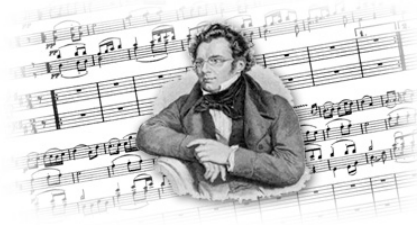
Les rendez-vous musicaux de la Grange

Rendez-vous, samedi 27 avril, à 18 h, au lieu-dit La Bourdère, à Caillavet, pour écouter le célèbre quintet de Schubert "La Truite" pour piano, violon, alto, violoncelle et contrebasse.