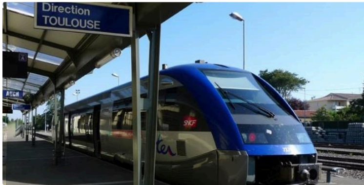
Bien Vivre dans le Gers et la mobilité dans le département

L'association Bien Vivre dans le Gers lance les États Généraux de la Mobilité dans le Gers, en organisant des réunions publiques dans plusieurs villes, afin d'aller à la rencontre des habitants, de leur permettre de s'exprimer sur la situation des transports dans le département et de recueillir leurs demandes et suggestions.