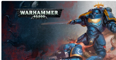
À la médiathèque municipale de Riscle, le mercredi 15 mai, de 14 heures 30 à 17 heures, un atelier Warhammer 40.000